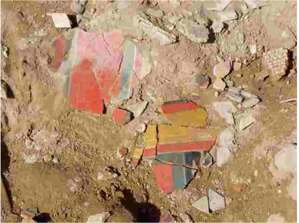
Agrigento - Quartiere ellenistico-romano. Scavo della Casa IIIM