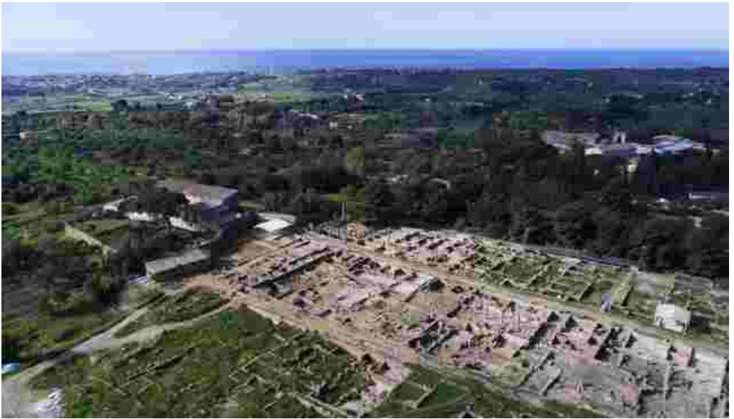
Agrigento - Quartiere ellenistico-romano